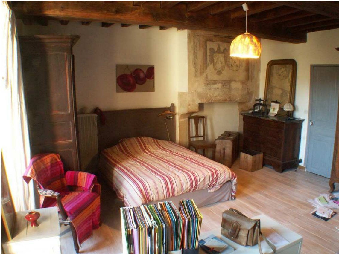
Une deuxième chambre : sol en tomettes, murs et plafond peints, double vitrage. Etat : moyen.