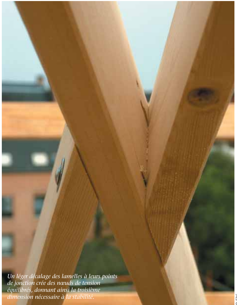
Un léger décalage des lamelles à leurs points de jonction crée des nœuds de tension équilibrés, donnant ainsi la troisième dimension nécessaire à la stabilité.

Après la mort de Henri II, il tomba en disgrâce et mourut onze ans plus tard à l'âge de cinquante-cinq ans en laissant une œuvre capitale, synthèse idéale de la Renaissance italienne et de la tradition française.